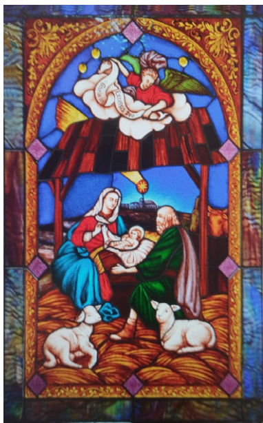
(betlém z dílny Skloart)