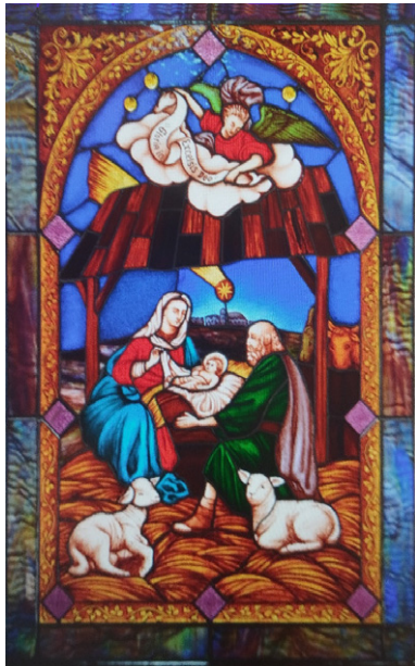
(vitráž pro město Žatec)