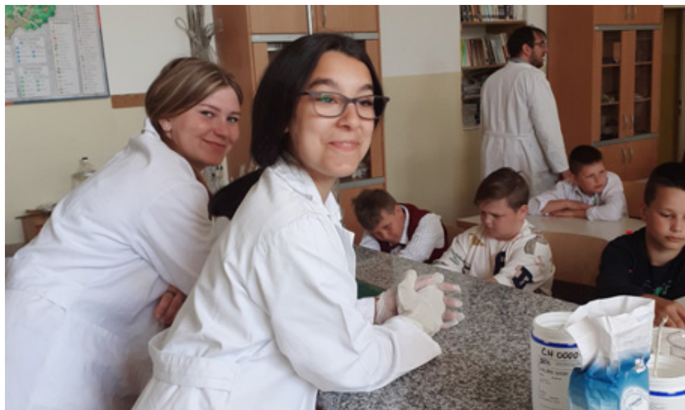
Den vědy