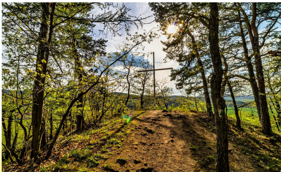
Bílý kříž

Hlas Lubenecka vychází jednou za 3 měsíce v počtu 300 ks. Vydání tohoto časopisu je povoleno Ministerstvem kultury a bylo mu přiděleno evidenční číslo MK ČR E 17184.