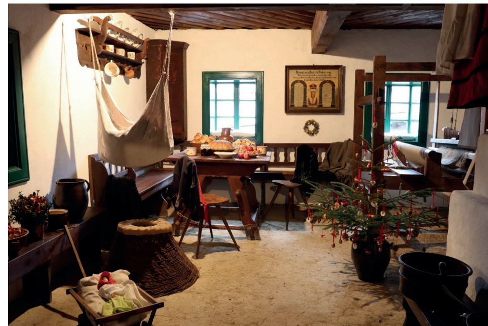
Vánoce ve skanzenu na Veselém kopci u Hlinska