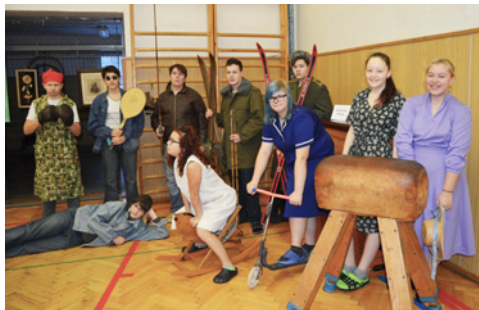
(Výstava Republika – leden 2019 – stoleté výročí vzniku Československa)