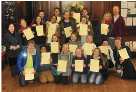
(listopad 2015 – jazyková škola Londýn)