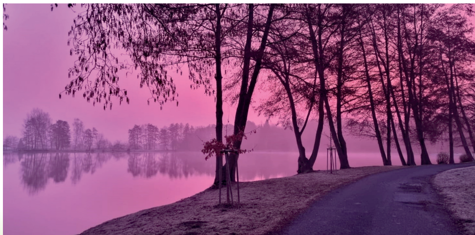
Ráno u rybníka

Hlas Lubenecka vychází jednou za 3 měsíce v počtu 300 ks. Vydání tohoto časopisu je povoleno Ministerstvem kultury a bylo mu přiděleno evidenční číslo MK ČR E 17184.