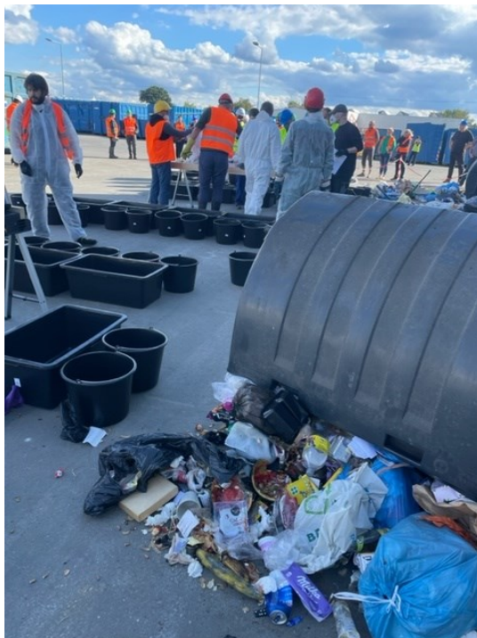
Ilustrační foto č. 4 – provádění rozboru smíšeného komunálního odpadu